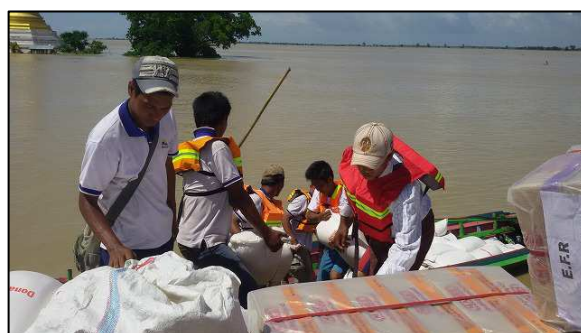
▲洪水により被災地は水没しているため、 物資はボートへの引き渡しとなりました。