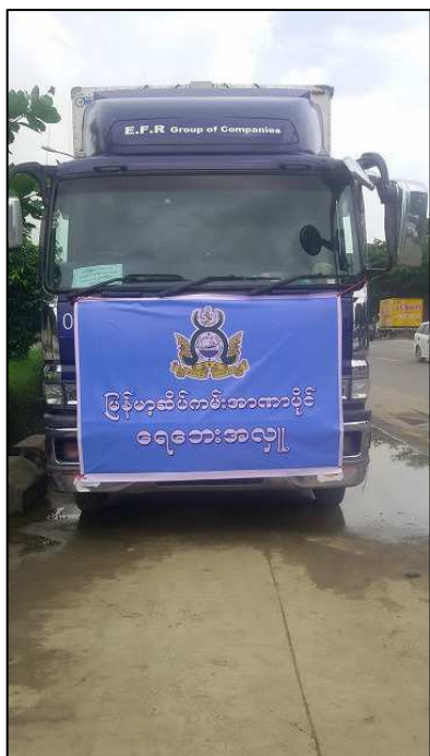
▲当社保有車両に掲げる政府機関の紋章