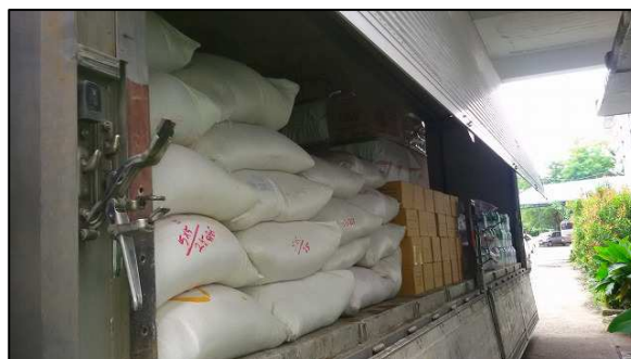
▲当社保有車両に積み込まれた緊急支援物資